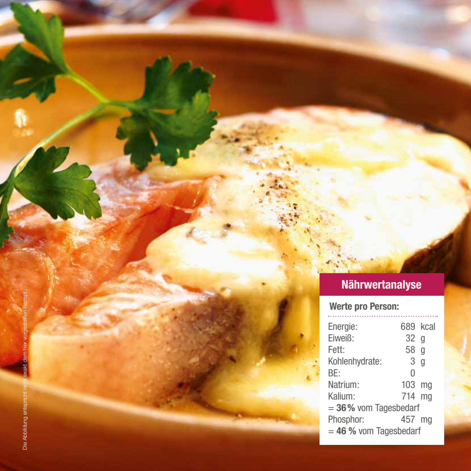
Die Abbildung entspricht nicht exakt dem hier vorgestellten Rezept.