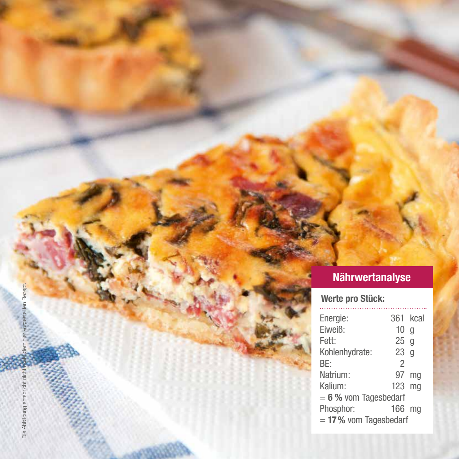
Die Abbildung entspricht nicht exakt dem hier vorgestellten Rezept.